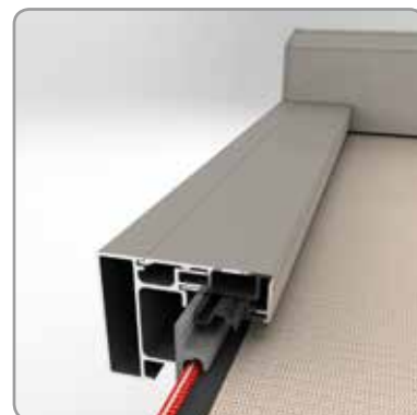
Coulisse: technologie Fixscreen®

* Essais en soufflerie par le Von Karman Institute : n° EAR0852