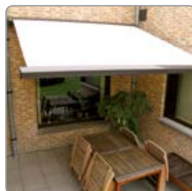
Vue de façade