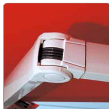
détail du bras articulé