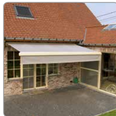
Vue de façade